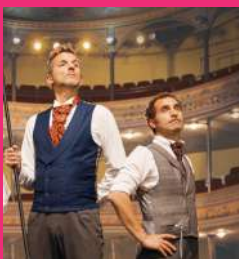
LA CLAQUE 27/09/2024 à 20h

Le coup d'envoi sera donné le vendredi 27 septembre avec le spectacle musical humoristique « La Claque » mis en scène par Fed Radix. Le lendemain les représentations se tiendront hors les murs avec les spectacles de rue « Drôle d'impression » et « Le Faux-Orchestre » proposés respectivement par les compagnies Dédale de clown et La Mue/Tte. Enfin, à la tombée de la nuit vous pourrez profiter du spectacle « La renverse » qui vous sera présenté par la compagnie Les ombres portées.