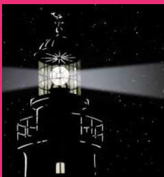
LA RENVERSE 28/09/2024 à 19h50