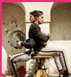
LE FAUX ORCHESTRE 28/09/2024 à 15h