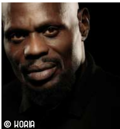
A HUIS CLOS KERY JAMES 27/05/2024 à 20h

Parmi les temps forts de cette saison : un lancement sur tout un week-end et totalement gratuit, le retour de Kery James, toujours aussi engagé mais cette fois-ci dans une pièce de théâtre, la star de l'humour D'jal, le décrypteur de la politique Clément Viktorovitch, le jazzman Michel Jonasz, le festival Africolor ou encore Password, mais aussi des pièces de théâtres classiques et contemporaines, qui seront autant d'occasions de découvrir et d'apprendre.