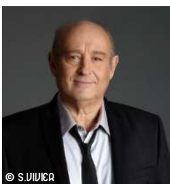
MICHEL JONASZ ET JEAN-YVES ANGELO 14/02/2024 à 20h