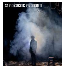
MONTE-CRISTO 28/01/2024 à 20h