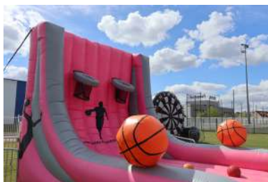
Plusieurs structures gonflables sur la thématique olympique.