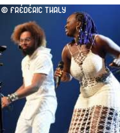
L'AFRIQUE EN-CHANTE KASSAV' 07/12/2024 à 20h