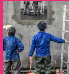
DRÔLE D'IMPRESSION 15/10/2023 à 16h