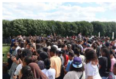
Les spectacles ont accueilli plusieurs centaines de Goussainvillois.