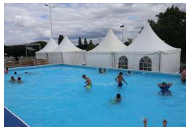
L'incontournable piscine de Gouss Olym'Plage.