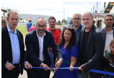
Inauguration de Goussainville Olym'Plage en présence d'Emmanuel Petit, champion du monde de foot 1998.

Cette nouvelle édition a rencontré un vrai succès. Nous sommes ravis que ce format olympique exceptionnel ait trouvé son public et que les Goussainvillois soient venus nombreux pendant ces cinq semaines d'animations. Ce fut une vraie réussite, grâce notamment à l'investissement de nos services et le soutien de l'Agglomération Roissy Pays de France. Nous avons pu promouvoir, de façon inédite, le sport sous différentes formes, faire découvrir de nouvelles disciplines aux Goussainvillois notamment la belle piste de roller de 300m2, une infrastructure vraiment inédite. Cela a renforcé notre esprit de ville sportive et conviviale. Nous vous donnons rendez-vous l'année prochaine pour de nouveaux moments à partager en famille et entre amis.