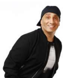
EN PLEINE CONSCIENCE DJAL 11/10/2024 à 20h