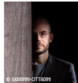
L'ART DE NE PAS DIRE CLÉMENT VICTOROVITCH 01/04/2024 à 20h