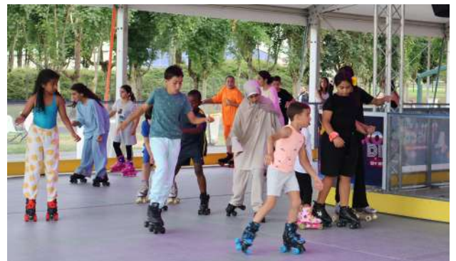
La grande nouveauté de cette année : la piste de roller