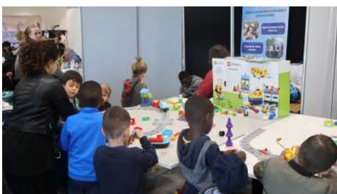
Stand de l'association à l'occasion du forum de la petite enfance

L'association a également inauguré en 2023 MathémaKids, des ateliers d'éveil aux sciences et aux mathématiques de 1h30 destinés aux 3 - 6 ans. Un concept qui pourrait, dans le futur, être élargi dans les écoles.