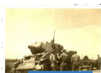
Entrée des chars de la 4 ème D.I.U.S à Goussainville