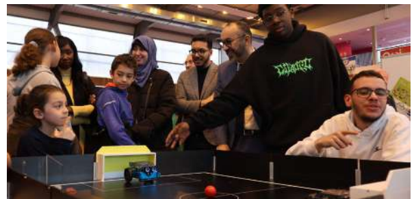
Stand de l'association à l'occasion de la semaine du numérique.