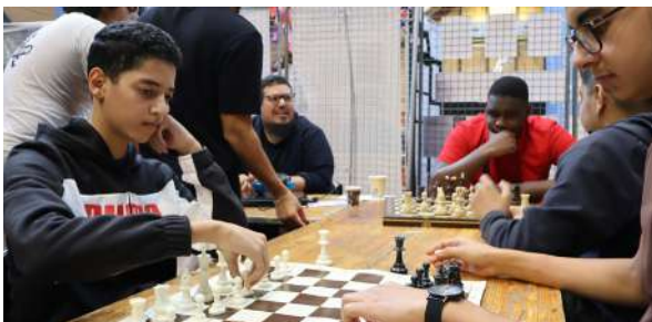
Stand de l'association MathémaCité lors du forum des associations 2024

MathémaCité est née de la volonté de rendre accessibles les sciences à tous. L'association oriente donc son action autour de trois axes, à savoir l'ouverture scientifique, en diffusant les sciences auprès d'un jeune public, l'éducation au numérique et à l'informatique, et enfin l'éducation en milieu scolaire, avec l'objectif d'intervenir auprès des établissements afin de faire découvrir les sciences aux tout petits. En parallèle, nous poursuivons notre travail autour des échecs avec la création de notre nouvelle association MathémaChess. Je suis toujours à l'écoute des adhérents afin de diversifier les activités. Je tiens d'ailleurs à remercier les bénévoles passionnés de l'association, qui s'investissent pleinement afin de proposer des idées et d'encadrer les ateliers. Nous entretenons une relation de confiance avec la municipalité, qui nous soutient dans nos actions et nous invite régulièrement à participer à ses événements. Nous travaillons également dans le cadre de la Cité Éducative de Goussainville.