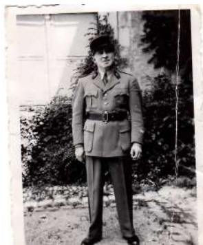
Gendarme goussainvillois le 29/08/1944